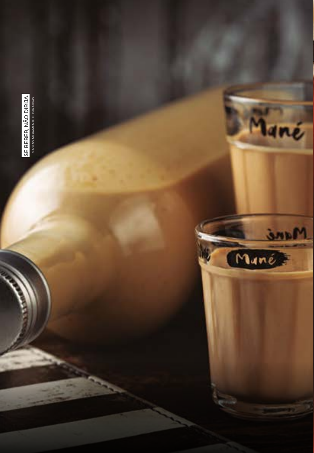
Batida Pé de Moça

SE BEBER, NÃO DIRIJA. IMAGENS MERAMENTE ILUSTRATIVAS