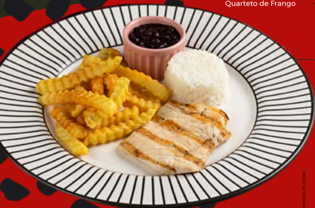
Quarteto de Frango