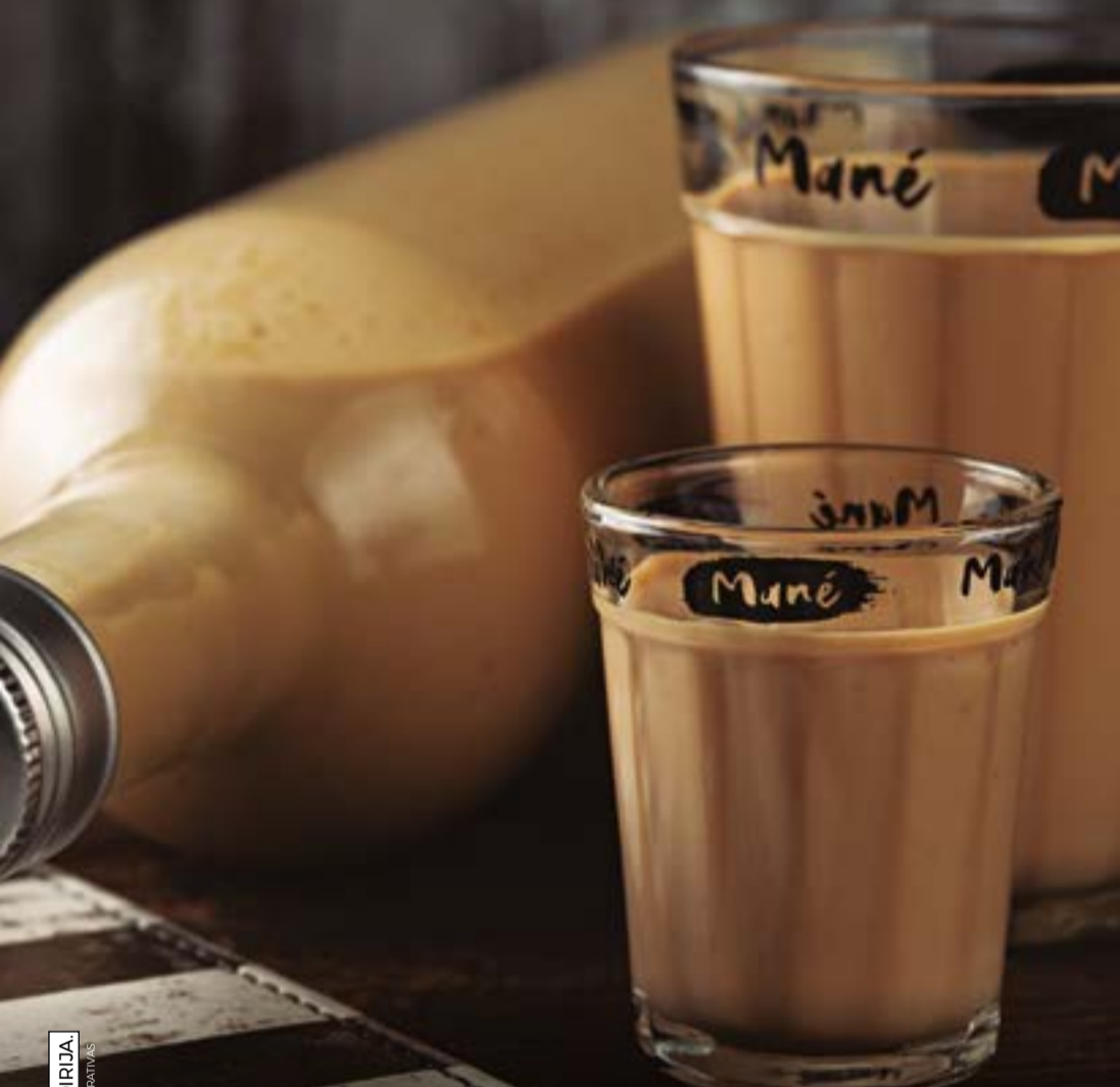
Batida Pé de Moça

Amarulla, Absolut de vanilla e espuma de gengibre.