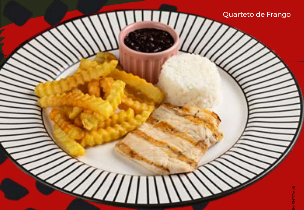
Quarteto de Frango