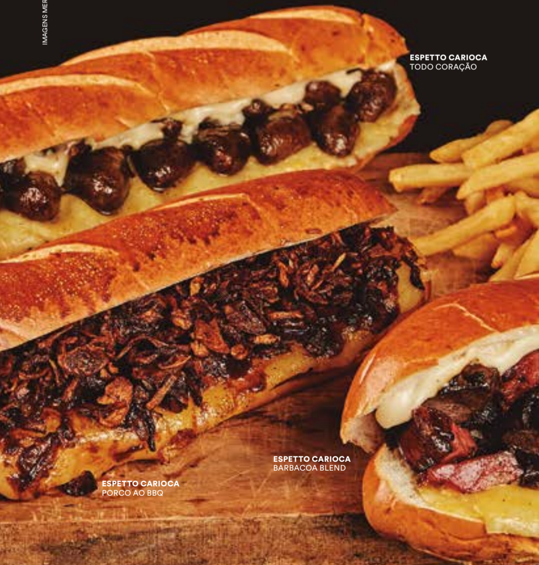
ESPETTO CARIOCA TODO CORAÇÃO